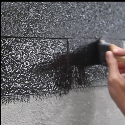
Cat Pelapis Batu Alam