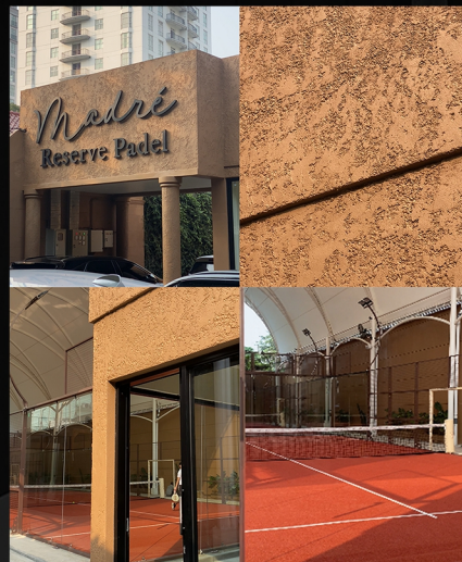
MADRÈ MENTENG RESERVE PADEL