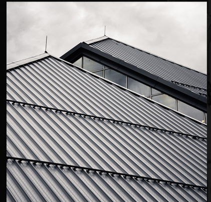
Cat Waterproof dan Penolak Panas