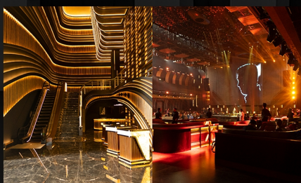
NOYA X 80 PROOF PIK 2