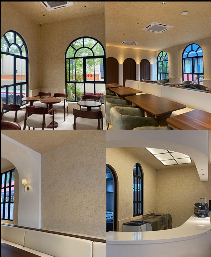
DES & DAN