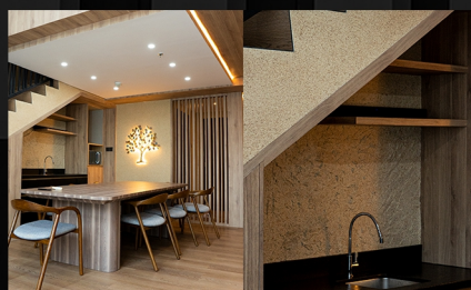
APARTEMEN NEO SOHO