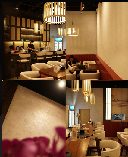
SANPACHI RAMEN 38