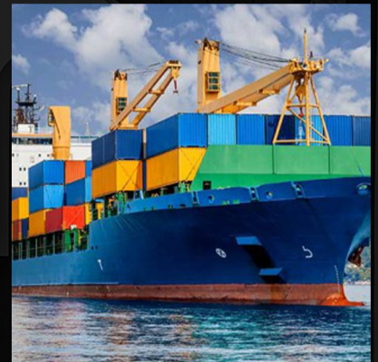
Cat Marine Protective