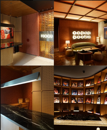
FOOGU BAR BY ISMAYA GROUP