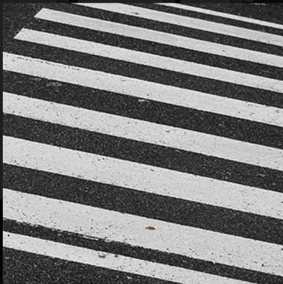
Cat Marka Jalan